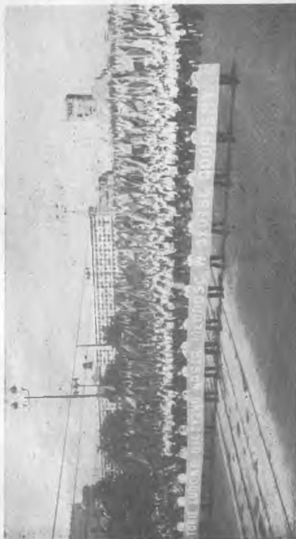
W pochodzie 1-majowym kolumna ZMS