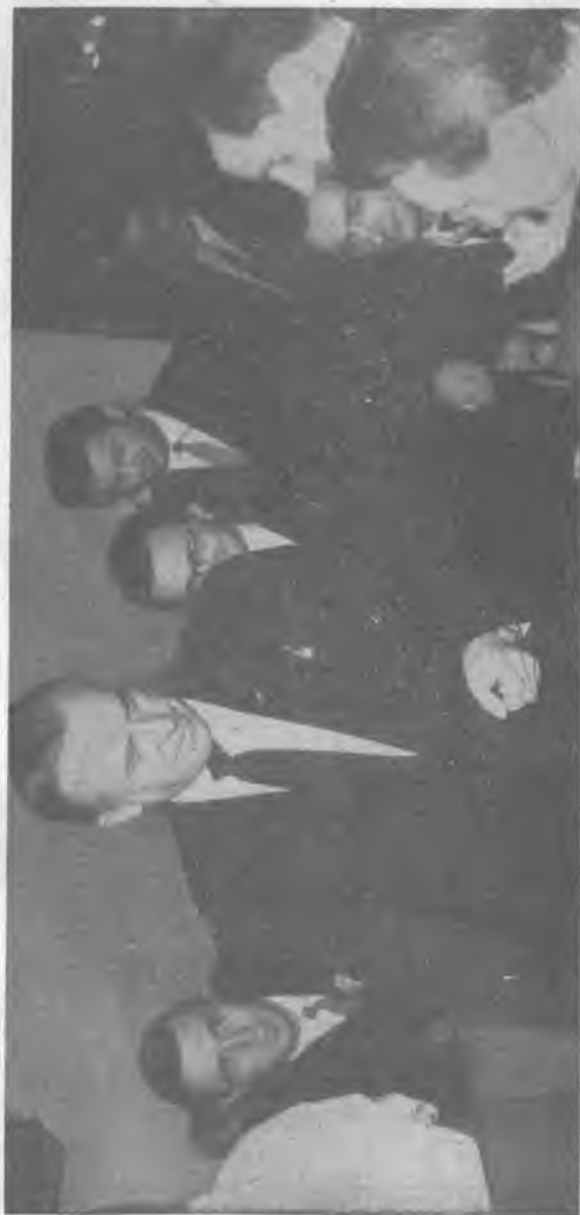
Spotkanie z tow. Marianem Spychalskim — Marszałkiem Polski — Budowniczym Polski Ludowej