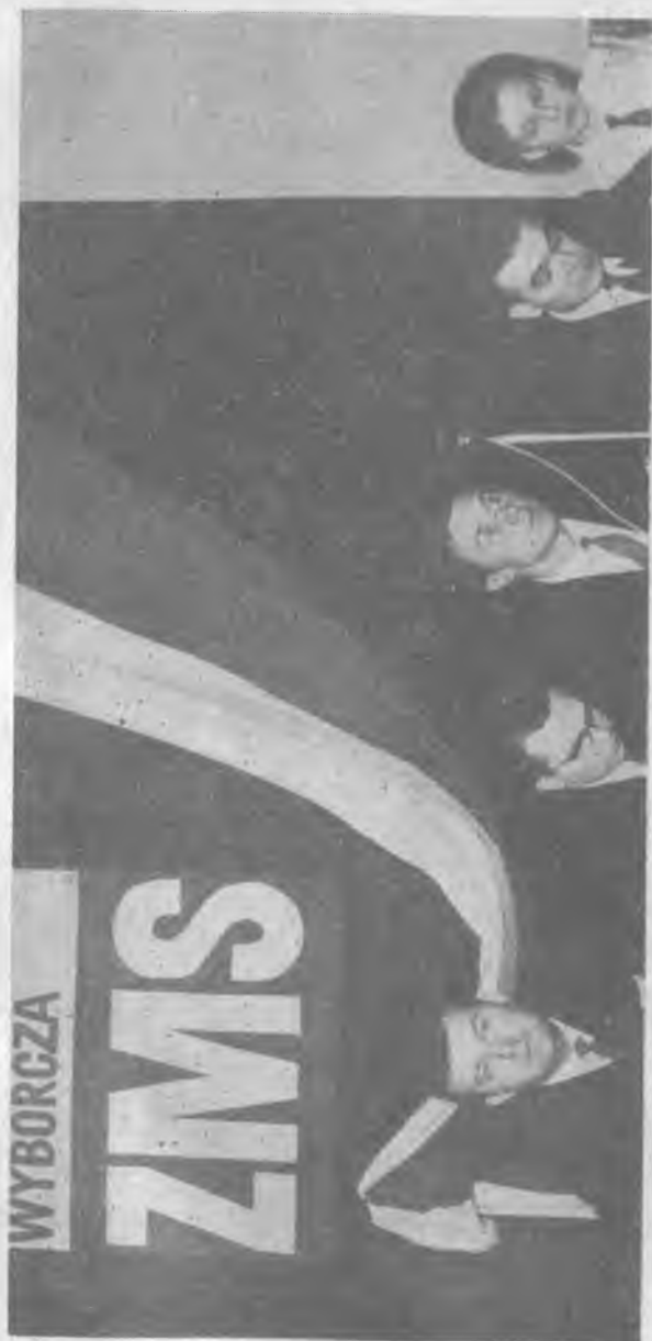
Prezydium VII Warszawskiej Konferencji Sprawozdawczo-wyborczej ZMS