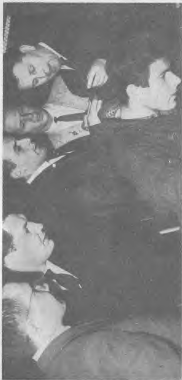
Delegacja młodzieży radzieckiej w FWP im. K. Świerczewskiego