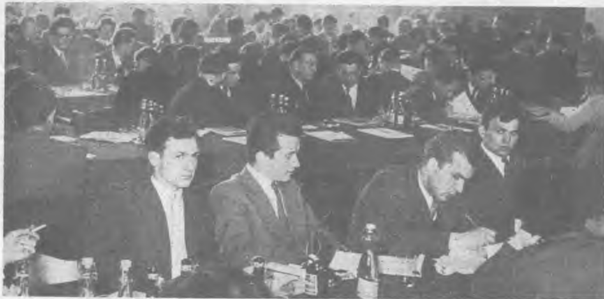
Sala obrad w czasie I Konferencji ZMS — na pierwszym planie delegacja UW

CALENDARIIUM WARSZAWSKIEJ ORGANIZACJI ZMS