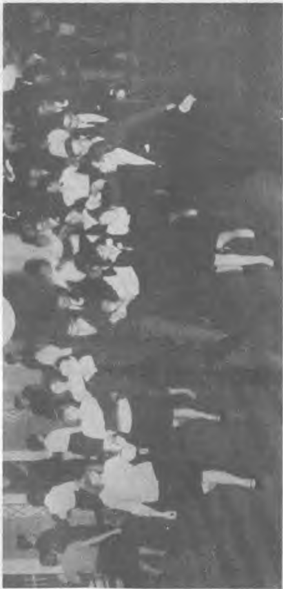
Jedna z „Zabaw jakich nie było” rozpoczyna się tradycyjnym polonezem