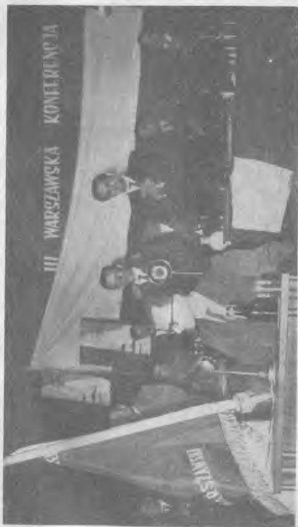
Wręczenie sztandaru warszawskiej organizacji